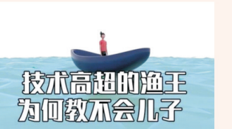
技术高超的渔王为何教不会儿子

一位路人听了他的诉说后，问：“你一直手把手地教他们吗？”“是的，为了让他们得到一流的捕鱼技术，我教得很仔细很耐心...”