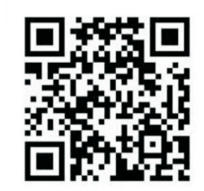
《最佳作品》评选 请扫二维码进行投票